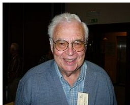
Gene Howard Golub (1932-2007):