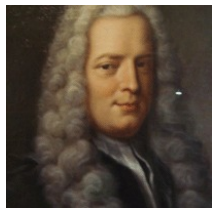
Gabriel Cramer (1704-1752):