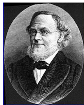
Hermann Graßmann (1809-1877):