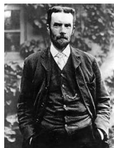
Oliver Heaviside (1850-1925):