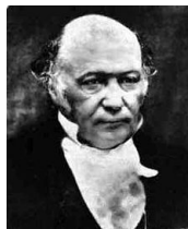
William Rowan Hamilton (1805-1865):