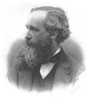
James Clerk Maxwell (1831-1879):